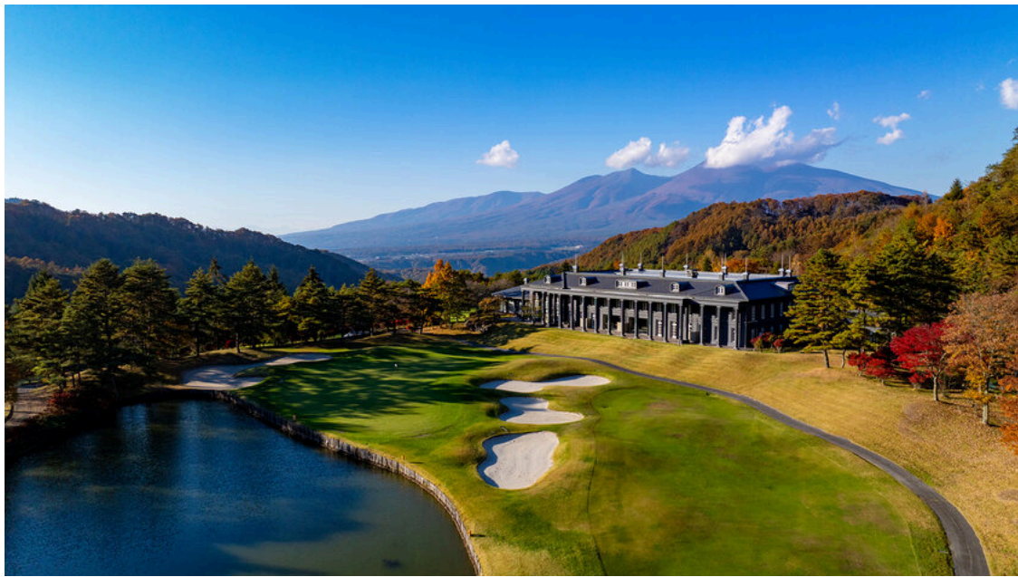
オーソルヴェール軽井沢倶楽部